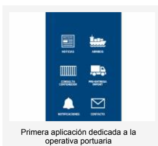
Primera aplicación dedicada a la operativa portuaria

Montecon trabaja e invierte permanentemente para mejorar los servicios relacionados con la actividad portuaria, apostando a la incorporación de tecnología y la capacitación de sus recursos humanos. En este contexto impulsó el desarrollo y puesta en producción de esta innovadora plataforma digital.